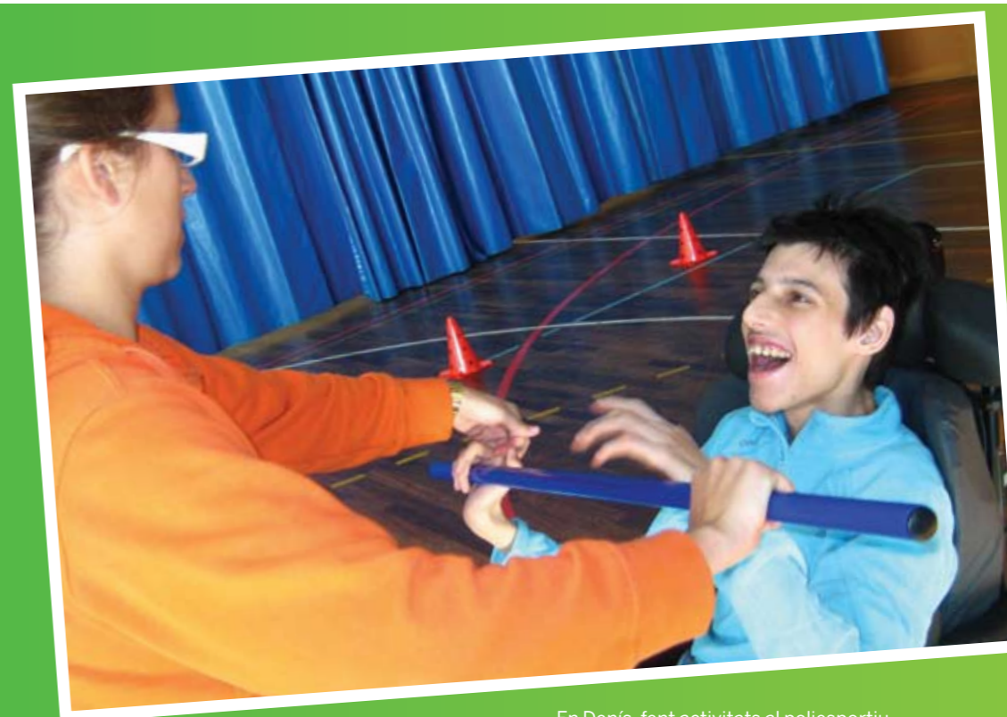
En Denís, fent activitats al poliesportiu.

Es muy importante realizar un previo calentamiento antes de someter el organismo de la transición del reposo a la posibilidad de un trabajo. Activamos a los usuarios con un tono de voz alegre y enérgico para motivarlos a la vez que les mostramos el material a utilizar para que lo visualicen antes de colocarlo en las zonas donde cada uno trabajará de forma individual. Después iniciaremos el contacto corporal, realizando fricciones para que entren en calor, con lo que a la vez realizamos un trabajo de conciencia corporal e imagen motora.