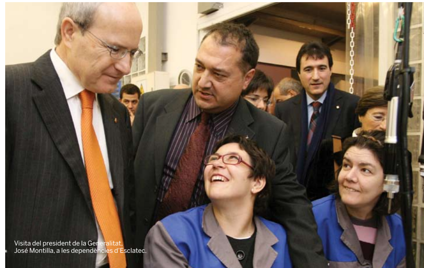
Visita del president de la Generalitat, José Montilla, a les dependències d'Esclatec.

Nosotros no podíamos crear un CEE que simplemente elaborara manipulados para otras empresas, porque los trabajadores y trabajadoras de Esclatec presentan, todos, una gran discapacidad física. Así pues, debíamos apostar por un producto más complejo, más tecnológico: menos cantidad pero más calidad, una característica obligada y diferencial de nuestro centro.