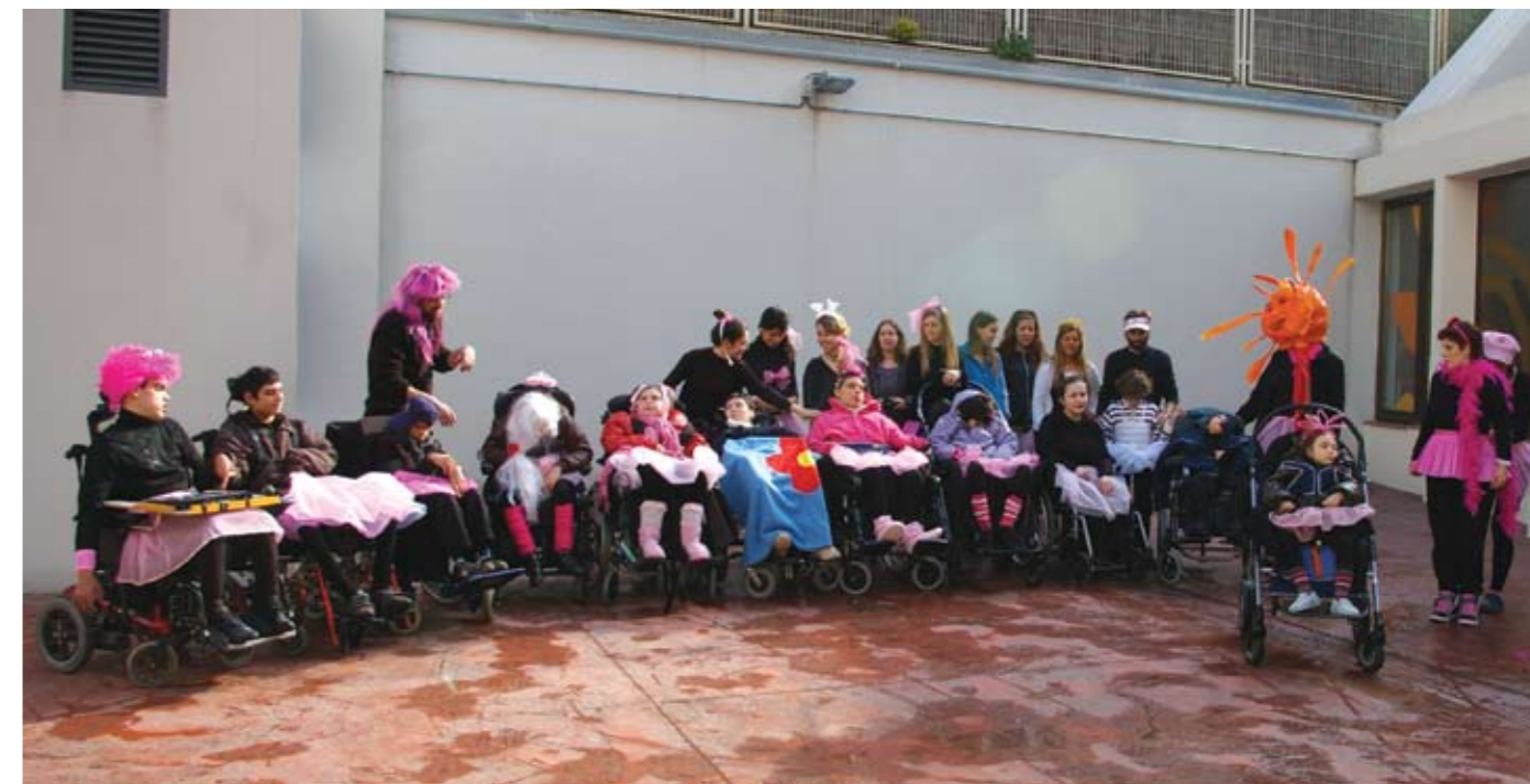
Tots preparats per celebrar el Carnestoltes al pati de l'escola.

Para acabar, se hace necesario dejar constancia de unos cuantos agradecimientos. En primer lugar, a la escuela Ítaca, por ofrecernos la oportunidad de consolidar esta actividad. En segundo lugar, a nuestros padres y madres, por implicarse tanto en la elaboración de los disfraces, por su asistencia y apoyo. En tercer lugar, a todo el equipo pedagógico de la escuela, por la seriedad con la que se toman la participación en la coreografía. Y, para finalizar, y siempre lo más importante, a nuestros niños y niñas, que con muestras de ilusión nos han ido animando, año tras año, a preparar actuaciones cada vez más complicadas. T