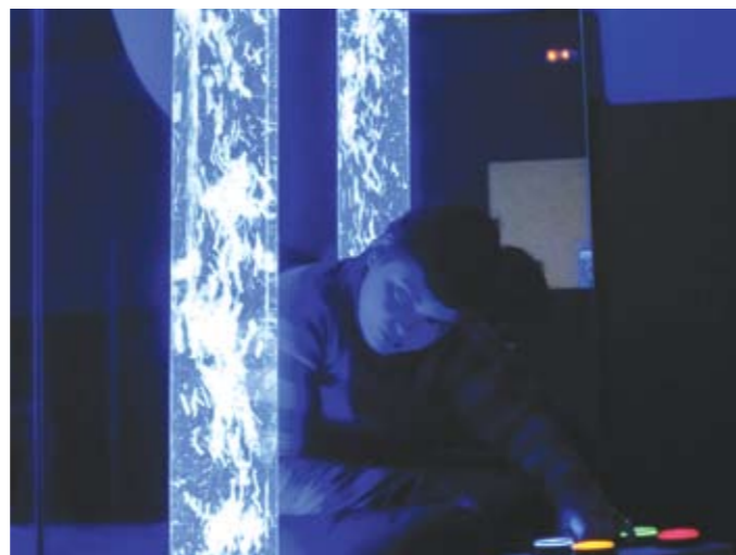
L'experiència a la sala multisensorial d'Esclat va centrar la ponència de les autores.

La jornada es va celebrar el 5 de febrer de 2011 a la sala d'actes del Centre Mèdic Teknon, amb l'assistència i la participació de molts pares, mares, germans i germanes de persones afectades d'aquesta síndrome, així com de professionals de diferents entitats i disciplines especialitzats o que mantenen una atenció directa amb aquestes persones, com ara metges, fisioterapeutes, nutricionistes, psicòlegs i educadors.